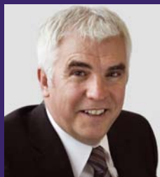
Jeff Rooker Cadeirydd

Aelodau Bwrdd yr Asiantaeth Safonau Bwyd a minnau sy'n gyfrifol am gyfeiriad strategol cyffredinol yr Asiantaeth. Rydym ni'n gweithredu ar y cyd er lles y cyhoedd ac rydym ni'n ymrwymo i sicrhau bod yr Asiantaeth yn parhau â'i diben hollbwysig, sef bwyd diogel a bwyta'n iach i bawb. Mae'r strategaeth hon, sydd wedi'i datblygu drwy ymgynghori â'n holl randdeiliaid, yn diffinio'r diben hwnnw ac yn nodi'r amcanion, y blaenoriaethau a'r canlyniadau allweddol. Bydd y rhain yn parhau i sicrhau y gall defnyddwyr ymddiried yn y bwyd y maen nhw'n ei brynu a'i fwyta.